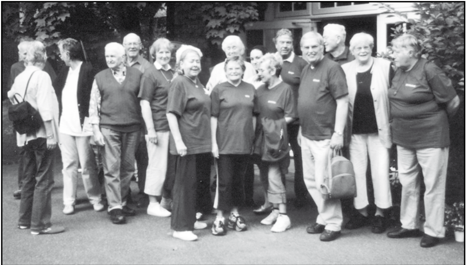
Die Nordic-Walking Gruppe nach Kaffee und Kuchengenuß vor dem Scheunenkaffee in Etzen