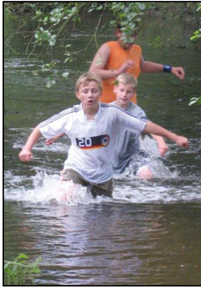
Voller Einsatz beim Geländespiel

Im nächsten Jahr muss das Zeltlager leider ausfallen, da ich aus persönlichen Gründen leider die Organisation nicht übernehmen kann. Aber der Termin für das Jahr 2010 steht schon, direkt nach der Fussball-WM in Südafrika direkt am Beginn der Sommerferien werden wir wie-